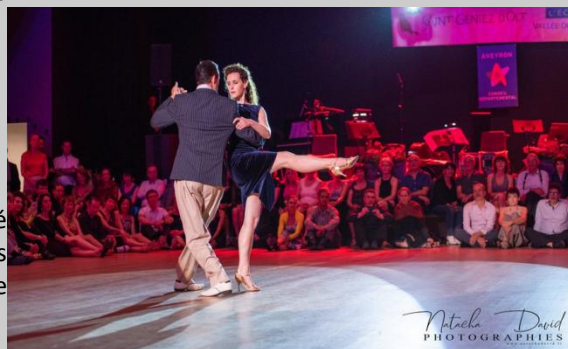
Le rendez-vous revient après deux années d'absence.

Le droit d'auteur veut dire que seul l'auteur peut autoriser ou interdire l'utilisation de son œuvre, gratuitement ou non. L'utilisateur ne dispose pas toujours de l'autorisation de l'auteur ou du titulaire des droits d'auteur pour utiliser l'œuvre. Par exemple : un organisateur du Festival qui autoriserait un quotidien à utiliser une photo qui ne lui appartient pas et dont il n'a pas demandé l'autorisation à l'auteur de la photo. L'association du Festival de Tango a l'autorisation des photographes de publier les photos sur son site mais pas de donner l'autorisation à d'autres personnes de publier un contenu qui ne lui appartient pas. Les images peuvent être utilisées pour la communication du Festival, dans un cadre raisonnable : pas de commercialisation et avec une citation du nom du Festival et du photographe (logiquement appréciée).